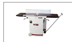
Réf : 10000296 Kit roulettes avec timon